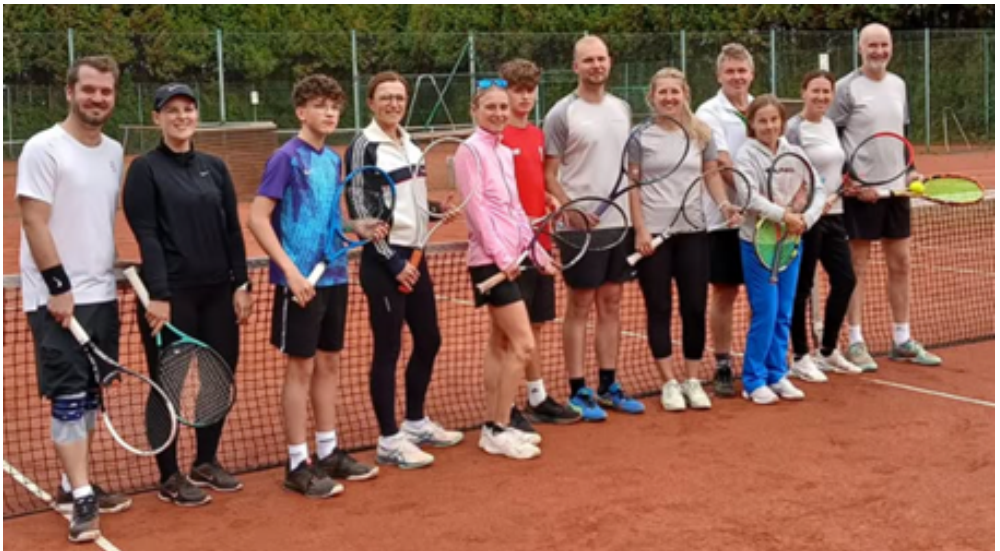
Teilnehmer der Clubmeisterschaften

Was bleibt, ist die Vorfreude auf das nächste Jahr. Ein riesiges Dankeschön an das gesamte Team – vom Platzwart über die Helfer bis zu den Zuschauern. Ihr habt diese Saison zu etwas Besonderem gemacht. Wir sehen uns in der neuen Saison!